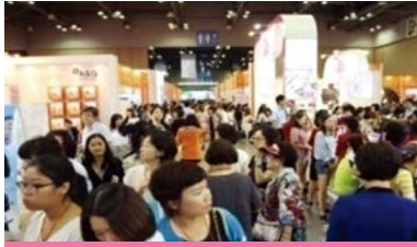
전시회 및 특별관

국내 기업관 해외 기업 초청관 공공기관/지자체관 의료관광 특별관 뷰티 교육관 특별관(뷰티 갤러리, 맨즈 뷰티관, 뷰티 마켓)