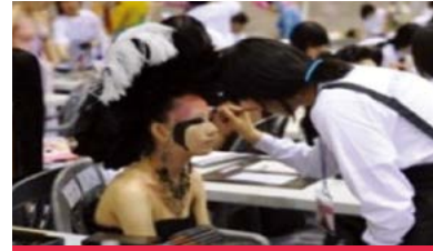
체험 및 문화

수출 상담회 MD 초청 설명회/구매 상담회 해외 진출 전략 세미나 미용병원 실무자 세미나 의료 관광 세미나 중국 단체 관광 투어 화장품산업 전문가 교육